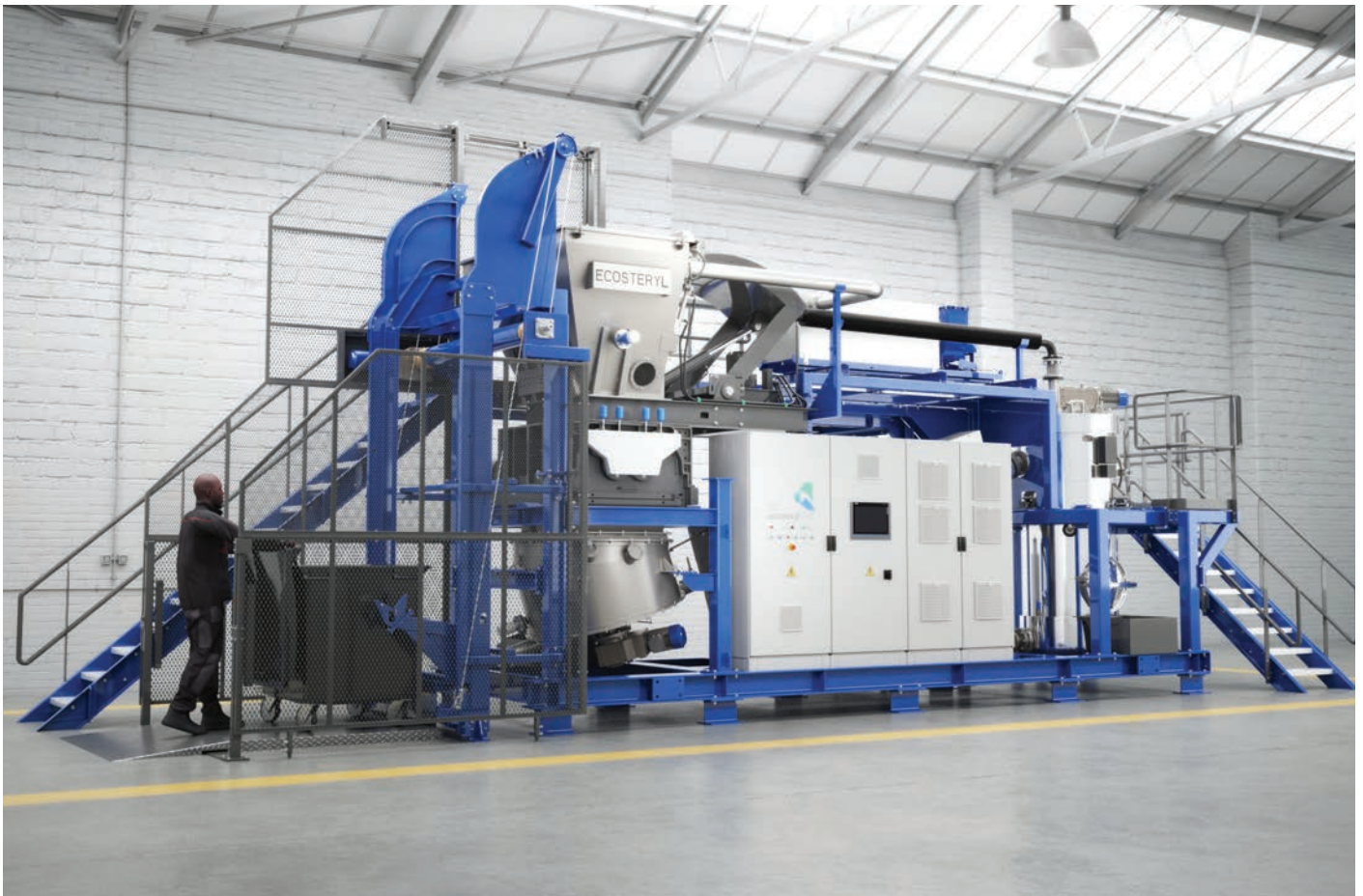
De Ecosteryl is de cruciale eerste schakel van de recyclinglijn, die Du-Con Trade in Velsen-Noord bouwt om gecontamineerd medisch afval te kunnen verwerken.

eruit en verwijderen glas en keramiek, dat veel voorkomt in laboratorium-afval. Daarna kunnen we met twee duale NIR's vier kunststofsoorten scheiden. Tot slot van het proces gaat het materiaal in big bags.'