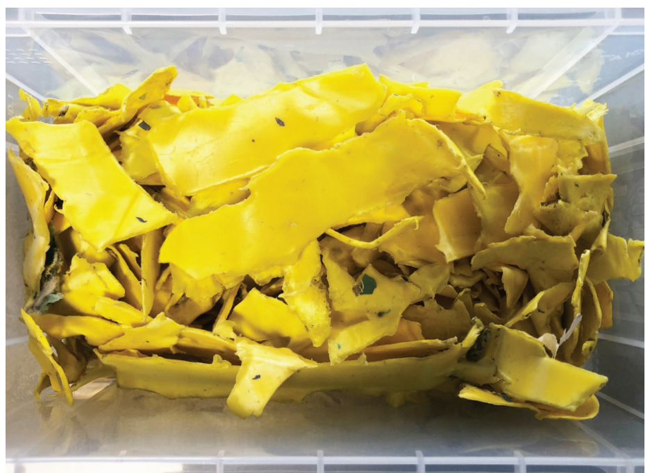
Fracties van het materiaal na decontaminatie door de Ecosteryl.